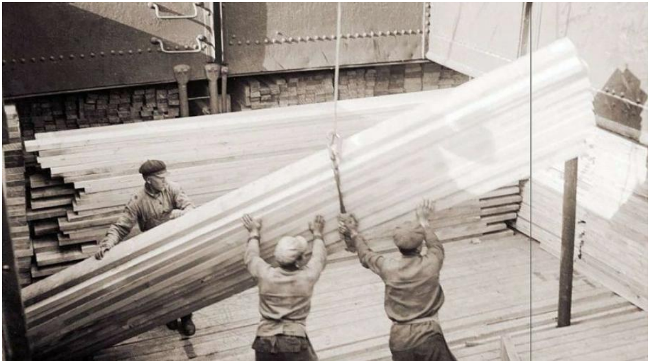
Архангельск, 1930 год

Ленин реализует «возможность правильно заготовить лесной товар и вывезти его в гигантских размерах», чтобы закупать за границей необходимые стране «паровозы, машины, электрические аппараты».