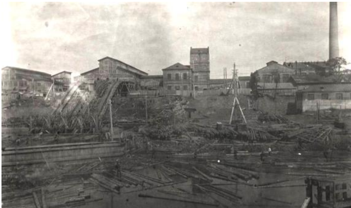
Мезенский лесопильный завод, 1930 год

Развитие Архангельской губернии/области в 1920-30-е годы происходит в русле преобразований всей страны: индустриализация, коллективизация и труд узников концентрационных лагерей.