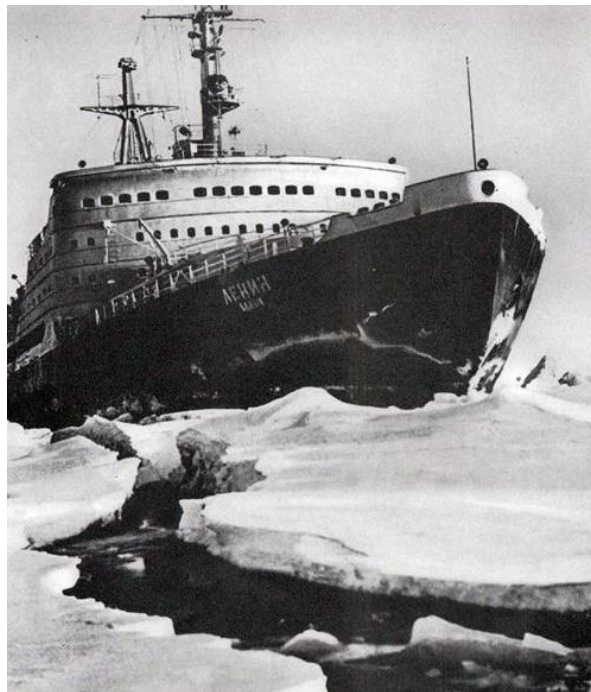
Атомный ледокол Ленин

В годы Хрущева СССР продолжал активно развивать науку. Затраты на нее в течение 1950-1960 годов выросли в 12 раз! Это дало большие результаты. Советские физики получали Нобелевские премии в 1956, 1958, 1962 и 1964 годах. В 1959 г. был построен атомный ледокол «Ленин» – первый в мире корабль, который получал энергию за счет расположенного на его борту атомного реактора. В 1955-1964 телевидение было распространено почти на всей территории СССР.