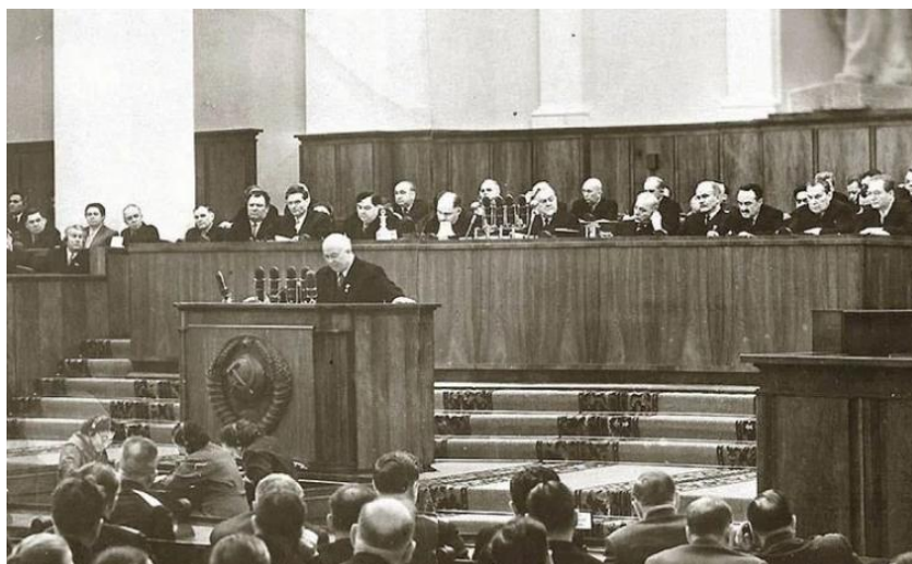
Хрущев выступает на XX съезде КПСС

Вместе с тем в 1953-1955 г. Сталин всё ещё считался великим руководителем, на многих портретах он изображался вместе с Лениным. Однако в феврале 1956 г. проходит XX съезд КПСС, где Хрущев выступает с докладом о культе личности Сталина. В этом докладе была сформулирована кардинально новая точка зрения о периоде правления Сталина. Хрущев прямо сказал, что массовые репрессии являлись тяжелым преступлением, в котором виноват именно сам Сталин, а также его соратники – Ежов и Берия. При этом о своем участии в сталинских репрессиях Хрущев умолчал.