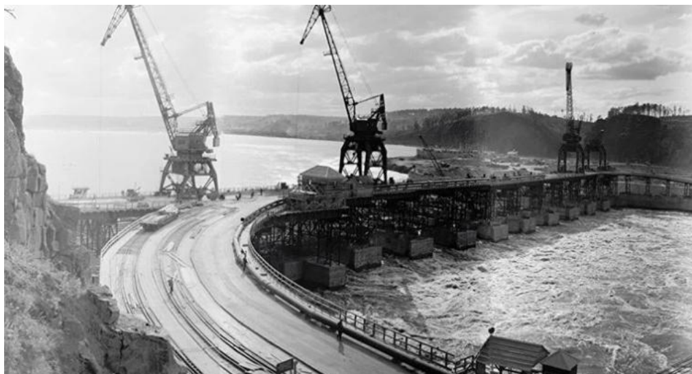
Строительство Братской ГЭС

После отстранения Маленкова от власти Хрущев акцент в развитии экономики снова был сделан на тяжелой промышленности. Активно увеличивается добыча нефти в Поволжье и Западной Сибири, строятся нефтеперерабатывающие заводы. Продолжается строительство гигантских гидроэлектростанций, в том числе одна из них, Братская ГЭС, впервые была построена в Сибири. Особое внимание уделялось развитию химической промышленности – производству пластмасс, химволокна, удобрений.