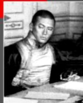
Лидер Народной революции Д. Сухе-Батор