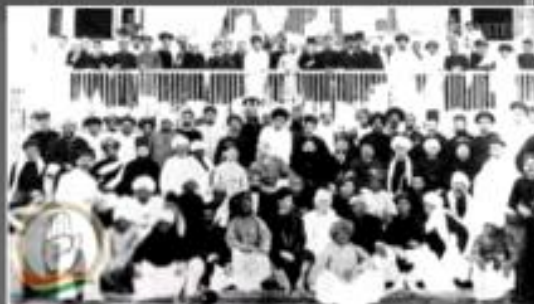
Индийский Национальный Конгресс

1928-1933 гг. – новый подъем движения. Главные требования - Конституция и статус доминиона для Индии наравне с Канадой и Австралией