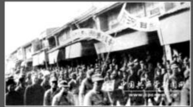
Антиимпериалистическое движение в Шанхае

Северные милитаристы и иностранные державы не признали южное правительство и избрание Сунь Ятсена. В 1923 г. Сунь Ятсен привлек к сотрудничеству Коммунистическую партию Китая. Возник единый фронт различных социальных сил, боровшихся против северных Милитаристов и империалистов