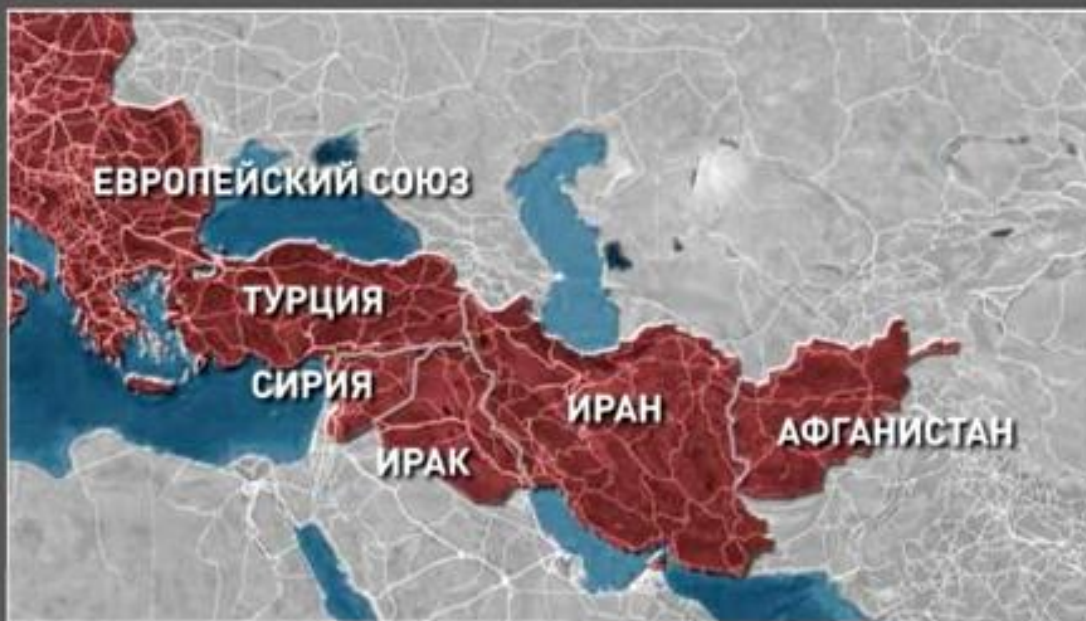
Карта Ближнего Востока

1921 г. Афганистан подписал договор о дружбе с Россией