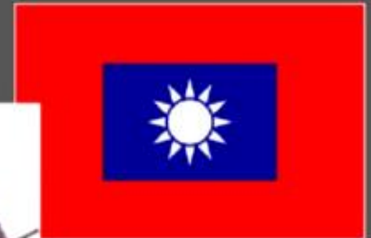
Флаг революционных сил