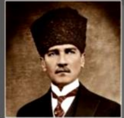
Мустафа Кималь, основатель современного Турецкого государства и его первый президент

Произошла новая национальная антиимпериалистическая революция в Турции . Ее лидером стал известный политический и военный деятель Мустафа Кималь