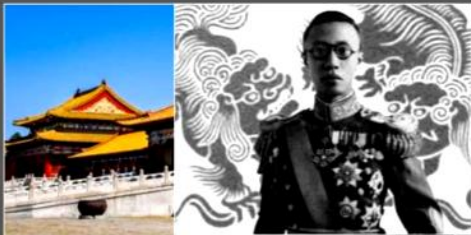
Последний император Пу И