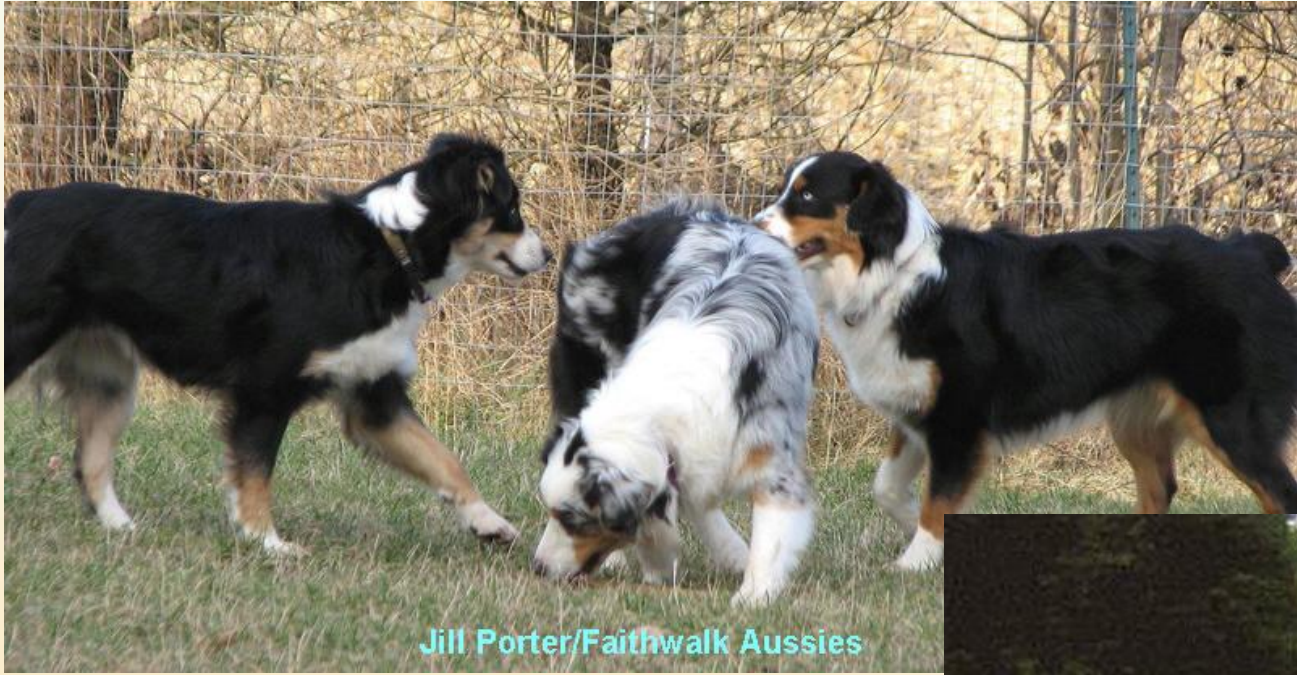
Jill Porter/Faithwalk Aussies