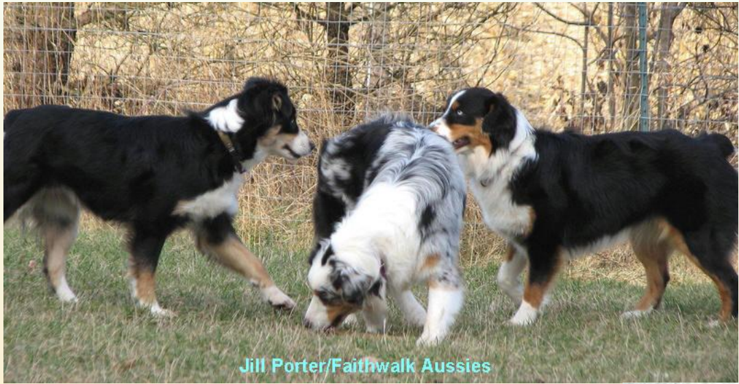
Jill Porter/Faithwalk Aussies